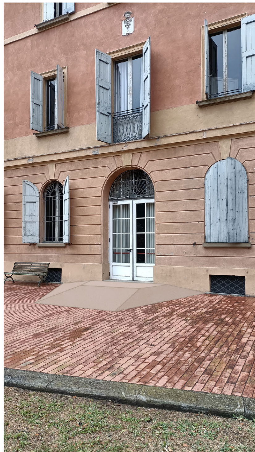
fotoinserimento: rampa su ingresso del corpo centrale