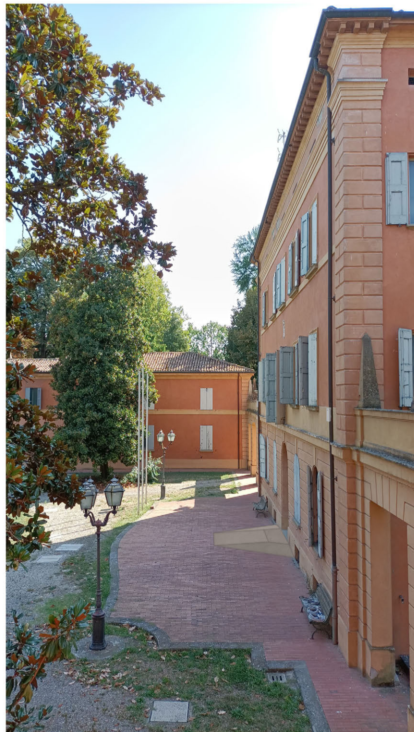
fotoinserimento: rampa su ingresso del corpo centrale e montaggio access point utilizzando i pluviali del fronte come supporto (all'altezza della fascia del piano primo)