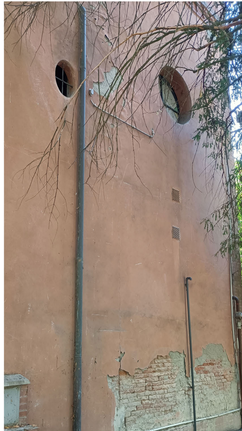
fotoinserimento: griglia esterna di protezione del foro di areazione, praticato ai fini del rispetto delle norme di sicurezza antincendio